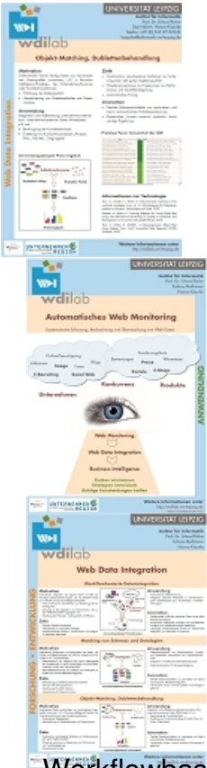
Workflowbasierte Datenintegration, Mapping von Schemas und Ontologien, Objekt-Matching, Dublette-Auflösung, Automatisches Web Monitoring